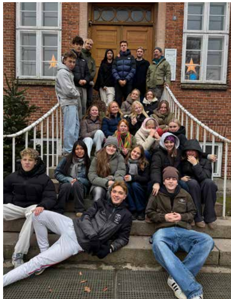
Alpha-deltagere efteråret 2025

På skolens sponsorløb løber eleverne for at andre må få det bedre. Også julemarkedet sidst i november 'skraber' mange penge sammen – så skolen i 2025 kunne videresende kr 80.000 til EFD's missionsfelter.