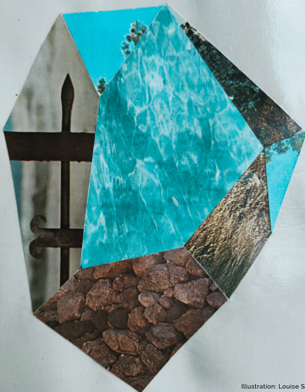
Illustration: Louise Skovgaard.