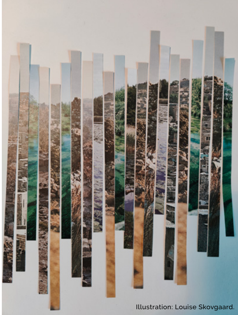
Illustration: Louise Skovgaard.

Det virkelige liv er sammensat af mange forskellige dele.