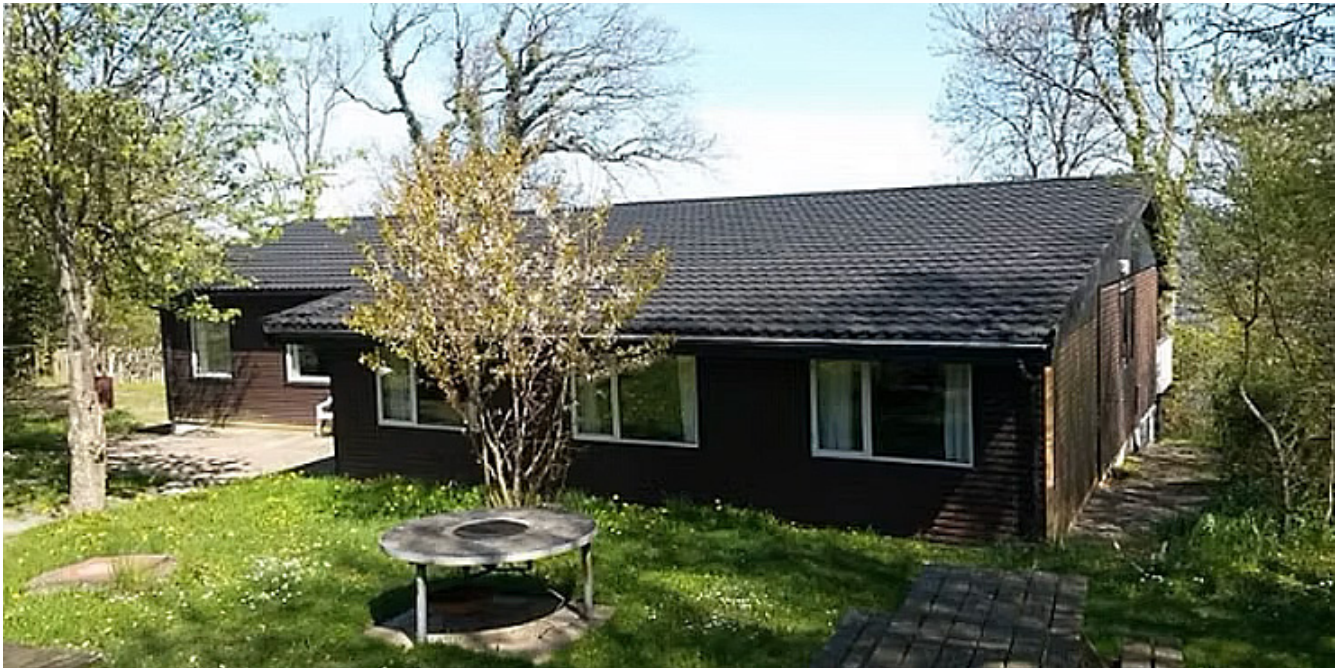
Lejrhytten "Klippen", en ressource med udfordringer.