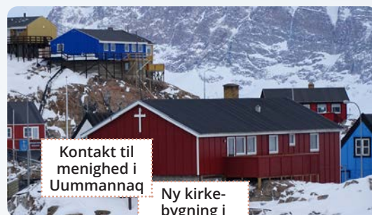
Kontakt til menighed i Uummannaq