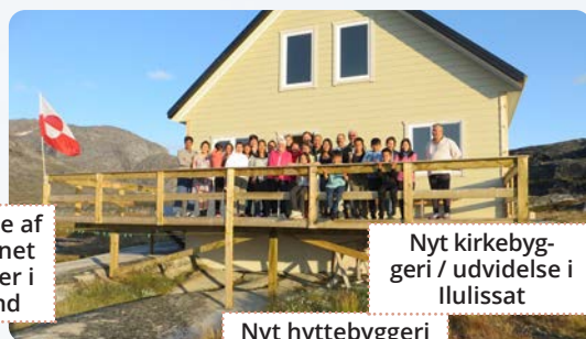
Nyt hyttebyggeri i Kangersuneq (efter brand)