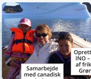
Samarbejde med canadisk missionsorganisation